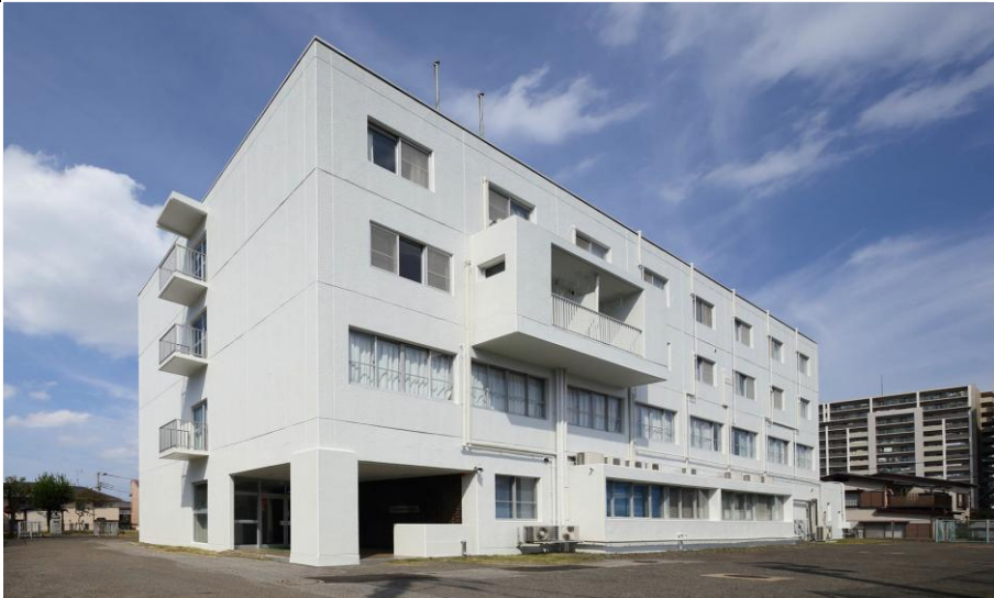
2011年耐震補強工事・2014年外壁塗替工事等・2015年寮室等改装工事終了